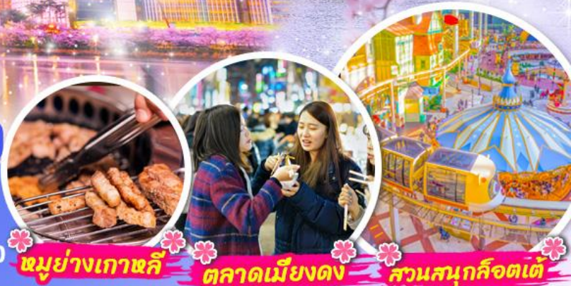
หมู่บ้านเกาหลี