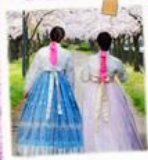
ใส่ชุดฮันบก