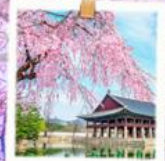
วังเคียงบกกุง